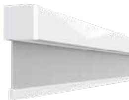
AERO™ SIMPLE | SIN CADENA