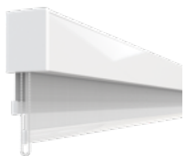
AERO™ DOBLE | CON CADENA