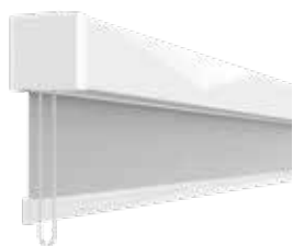
AERO™ SIMPLE | CON CADENA