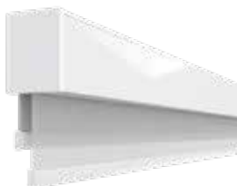
AERO™ DOBLE | SIN CADENA