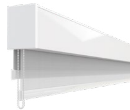
AERO™ DUPLA | CORRENTE