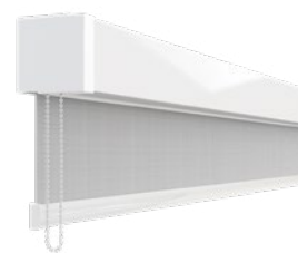
AERO™ SIMPLES | CORRENTE