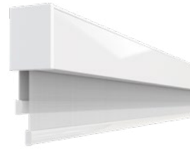
AERO™ DUPLA | SEM CORRENTE